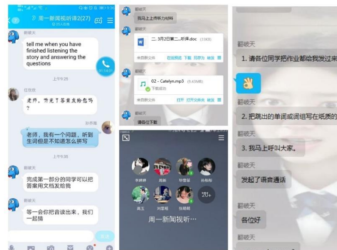
翻译系史国强教授 讲授《新闻视听译 2》课程与学生进行线上互动教学